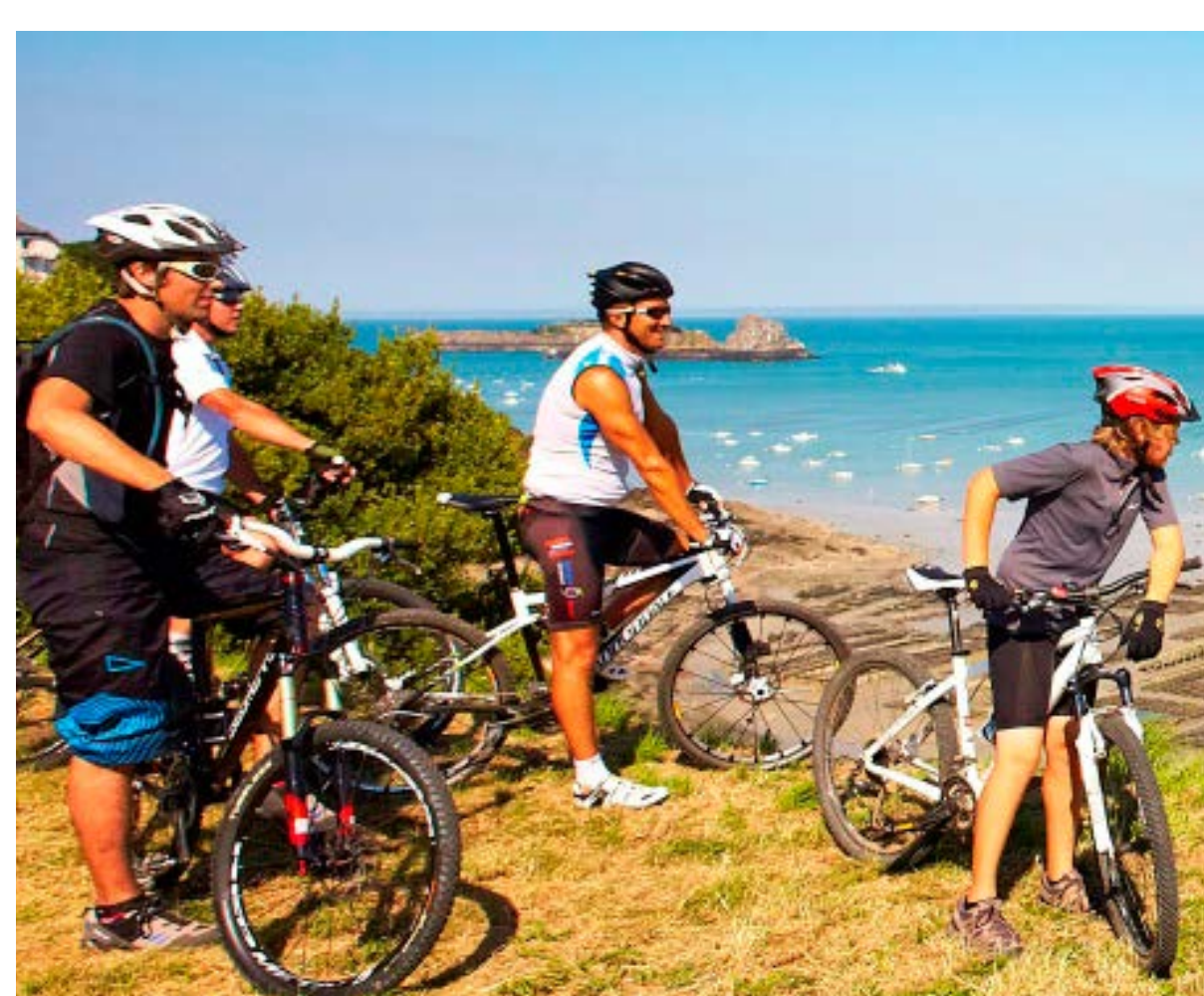
VTT sur la côte de Cancale

La côte de Cancale à Paramé se caractérise par une alternance de pointes rocheuses et de zones humides à l'abri de cordons dunaires (anse du Verger, anse Duguesclin).