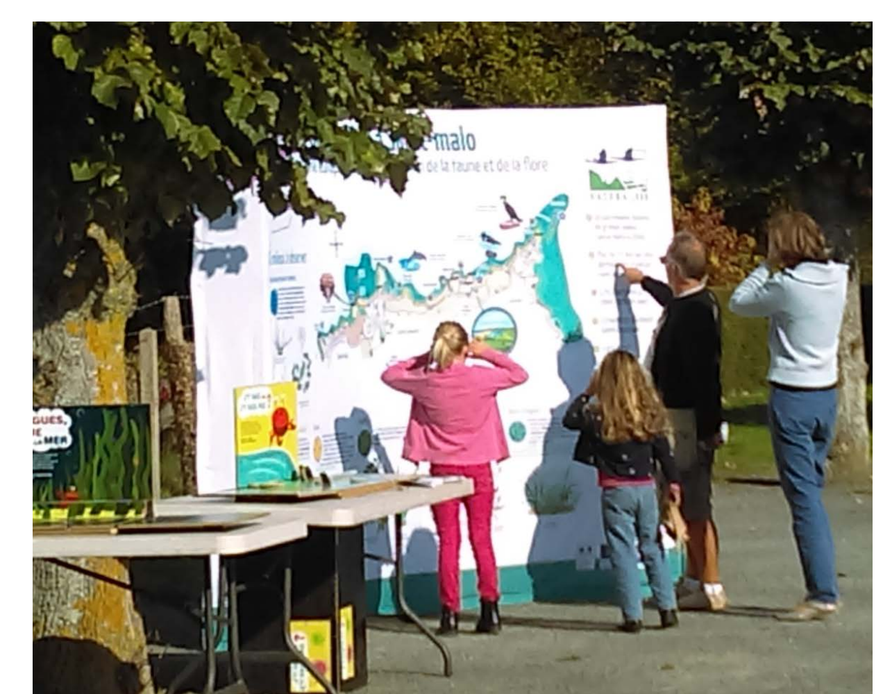
Spectateurs devant la carte de la zone