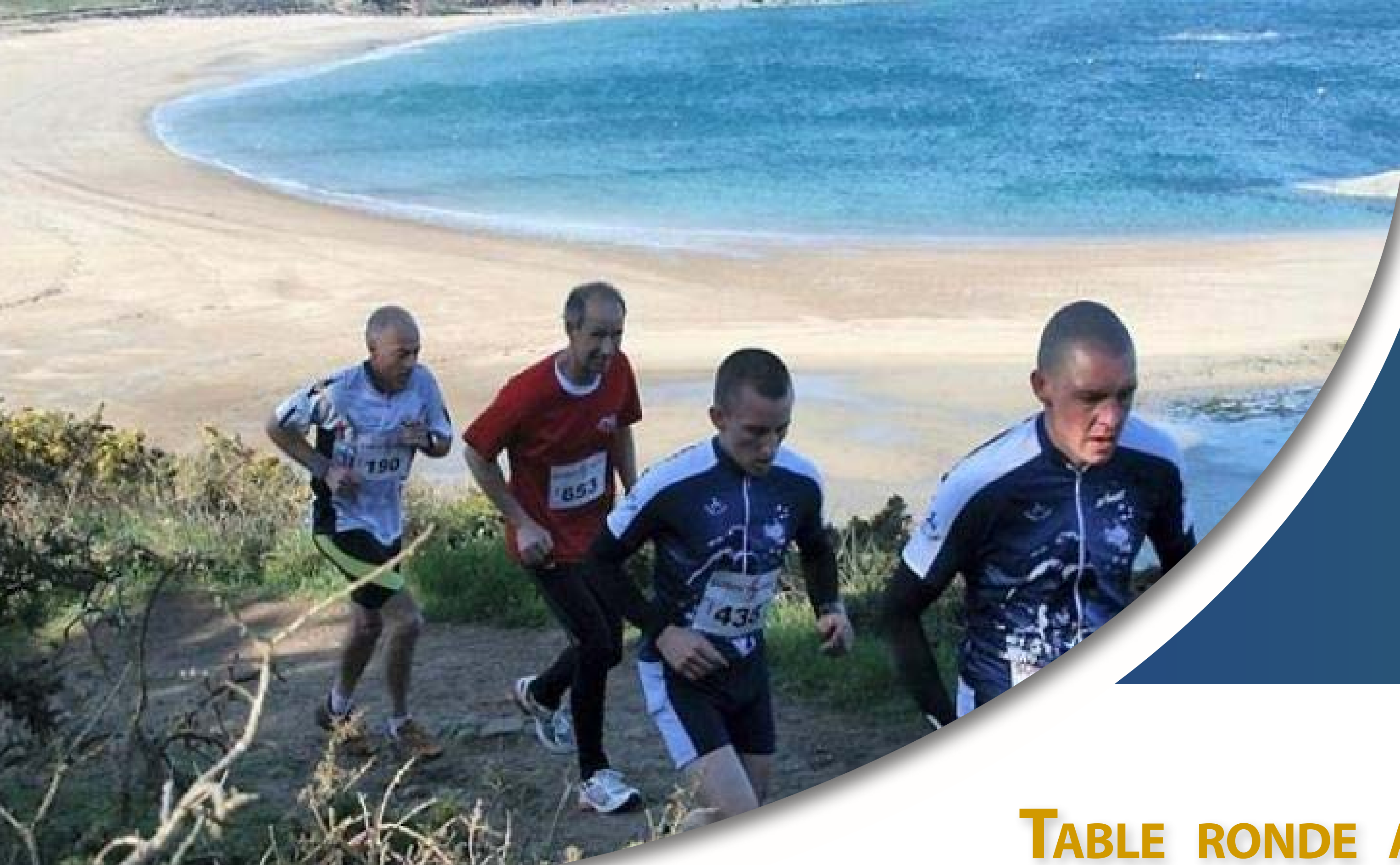
TABLE RONDE AUTOUR DES ENJEUX LIÉS AUX MANIFESTATIONS SPORTIVES

La côte d'émeraude et plus particulièrement, la partie de la zone allant de Cancale à Paramé est extrêmement touristique.