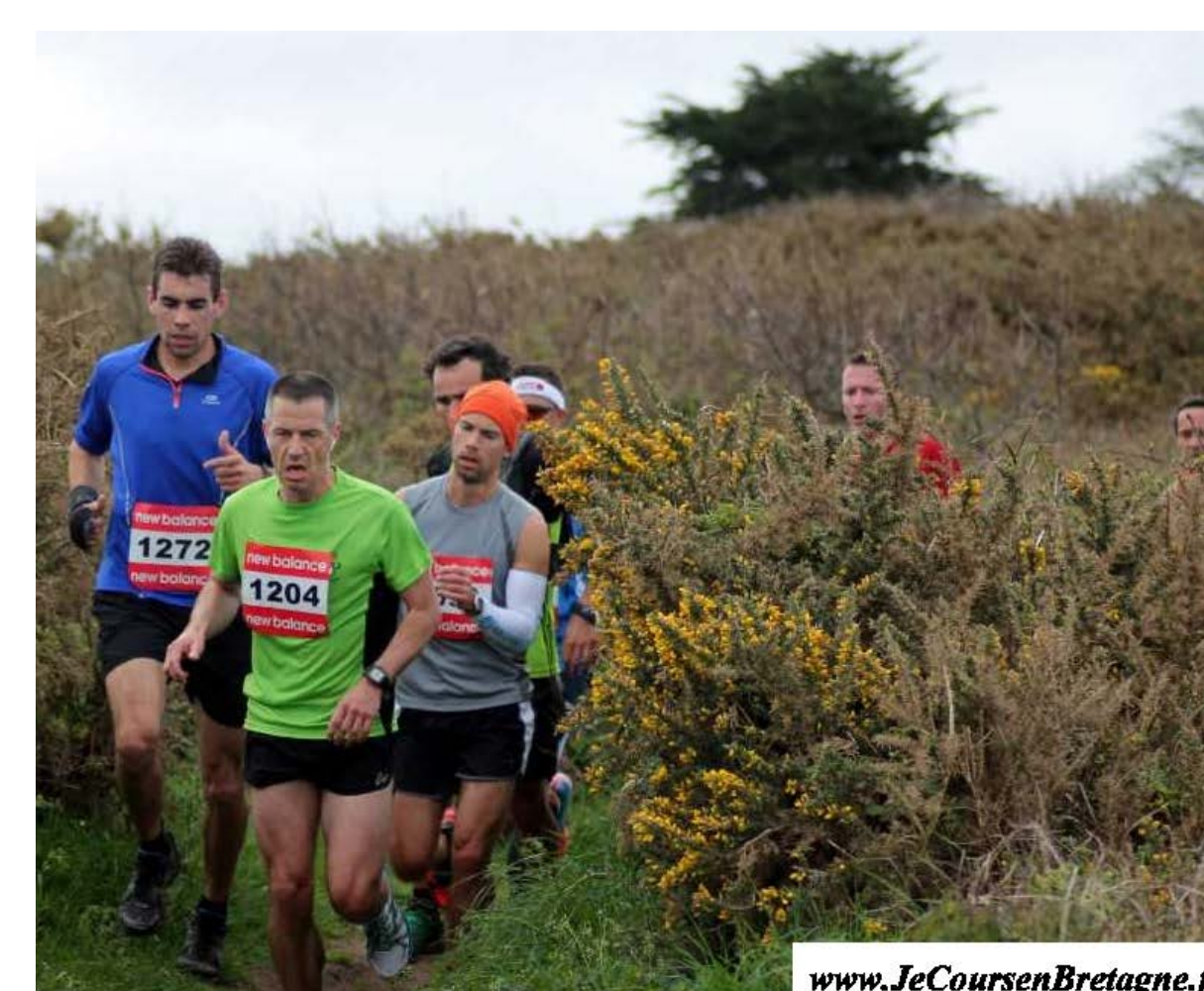
Trail entre terre et mer