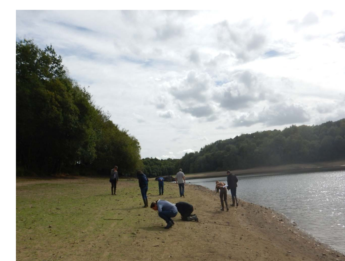
Campagne de recensement annuel en présence des élus