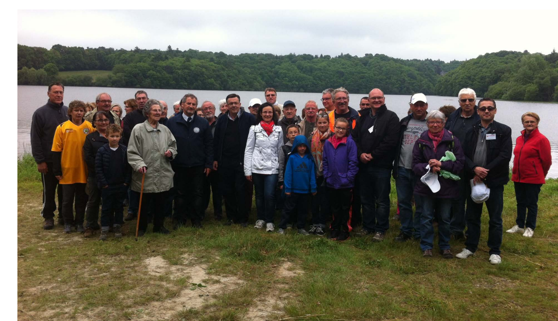
Animation découverte lors de la semaine du développement durable