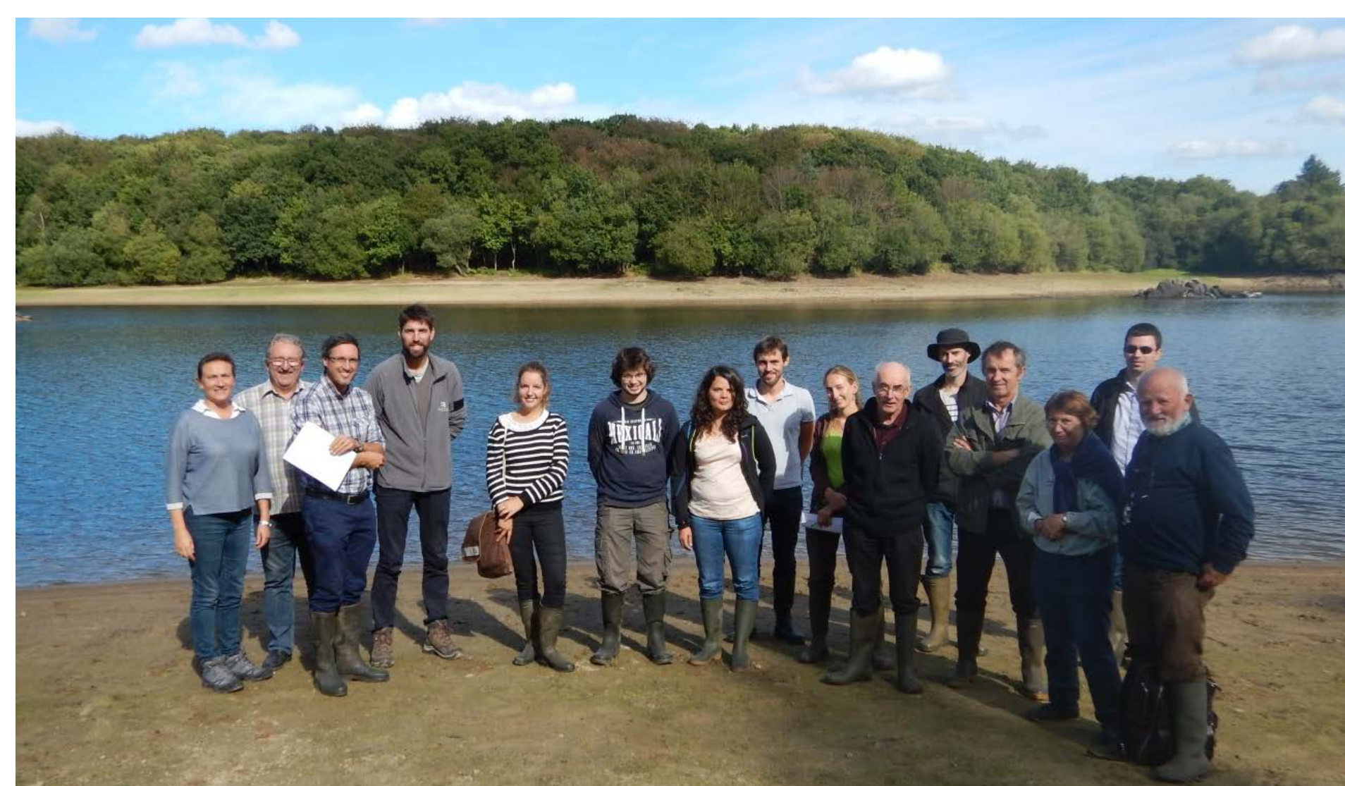
Réseau breton pour le Coléanthe délicat

Ce partenariat avec les acteurs/gestionnaires du site continue au-delà du plan de gestion. La création d'un parcours pédagogique autour des étangs et du cycle de l'eau est en cours et des balades découvertes sont régulièrement organisées.